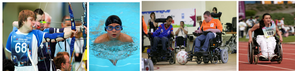
Financement de nos actions 2012